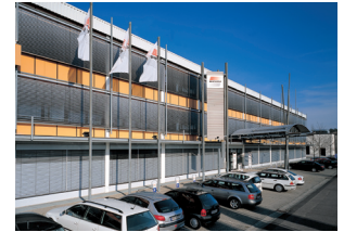
C WAREMA International GmbH/ Niederlassung Markt- heidenfeld/Marketing Nordring 2 97828 Marktheidenfeld