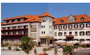
A Hotel Schöne Aussicht *** Brückenstraße 8 97828 Marktheidenfeld Tel.: +49 93 91 / 30 55 Fax: +49 93 91 / 37 22 www.hotelaussicht.de