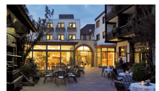
C Hotel Anker **** Kolpingstraße 7 97828 Marktheidenfeld Tel.: +49 93 91 / 60 04-0 Fax: +49 93 91 / 60 04-77 www.hotel-anker.de