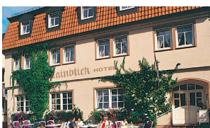
B Hotel Mainblick Mainkai 11 97828 Marktheidenfeld Tel.: +49 93 91 / 98 65 0 Fax: +49 93 91 / 98 65 44 www.hotel-mainblick.de