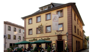
D Hotel Zum Löwen *** Marktplatz 3 97828 Marktheidenfeld Tel.: +49 93 91 / 15 71 od. 550 37 39 Fax: +49 93 91 / 17 21 www.loewen-marktheidenfeld.de