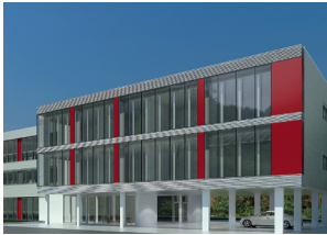
A WAREMA Kompetenzzentrum Dillberg 33 97828 Marktheidenfeld