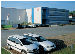
B WAREMA Kunststofftechnik- und Maschinenbau GmbH / WAREMA electronic GmbH Dillberg 33 97828 Marktheidenfeld